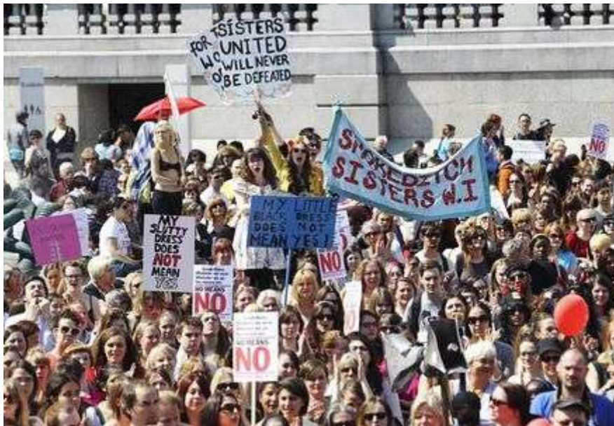
"Slutwalk" en Inglaterra.