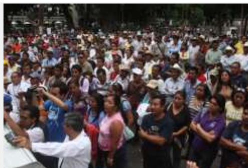
Maestros de la 59 escuchan a sus líderes frente a Palacio.

Asimismo, reiteró el respeto a los derechos humanos de los habitantes del Estado de Oaxaca por parte del