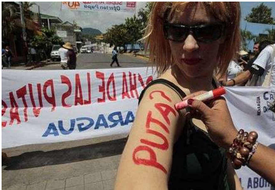
"La marcha de las putas" en Nicaragua.