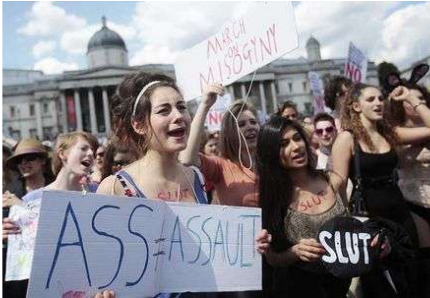
"Slutwalk" en Inglaterra.