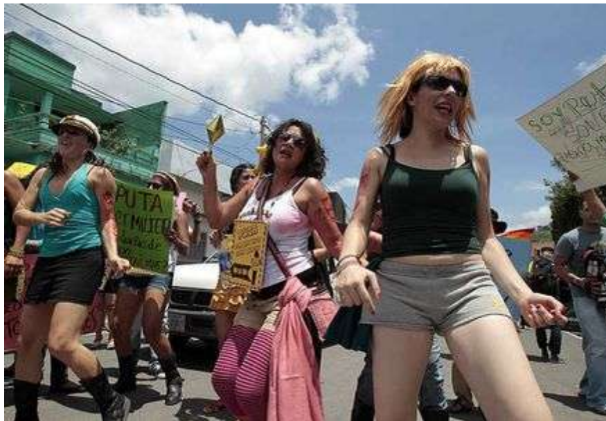
"La marcha de las putas" en Nicaragua.

México DF. Que mujeres víctimas de violencia sexual tengan acceso integral a los servicios de salud, los cuales deben incluir anticoncepción de emergencia e interrupción legal del embarazo, así como promover la denuncia y las sanciones administrativas, civiles y penales en contra de servidores públicos que cometan violencia de género institucional, fueron algunas de las exigencias que se dejaron escuchar la tarde de ayer durante la Marcha de las Putas.