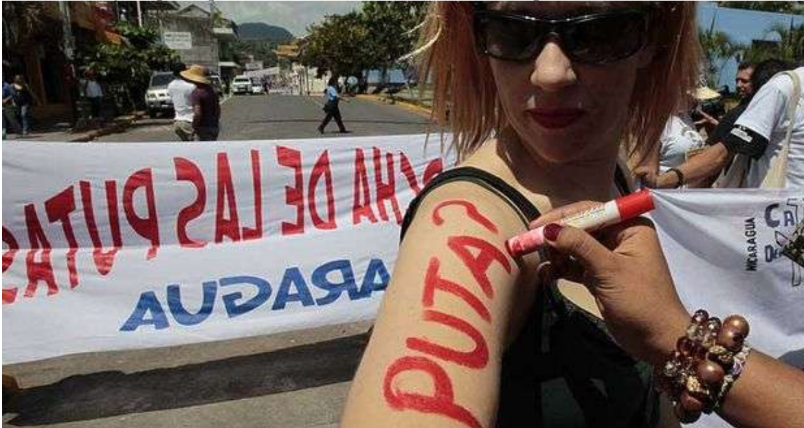
"La marcha de las putas" en Nicaragua.

Cientos de mujeres participan a nivel mundial de la "marcha de las putas"