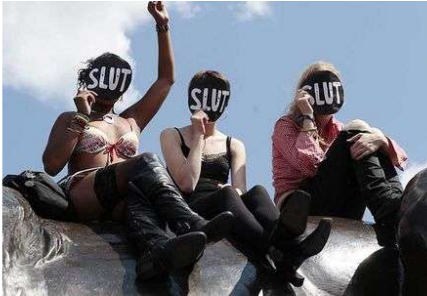
"Slutwalk" en Inglaterra.