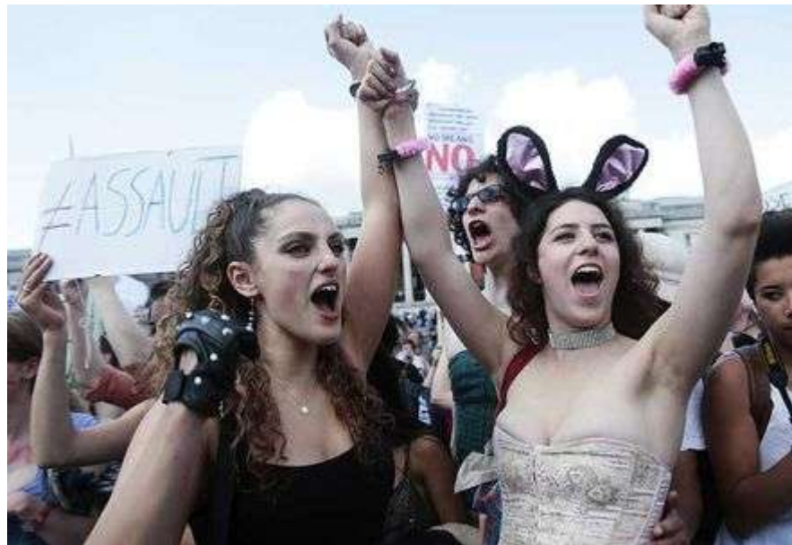
"Slutwalk" en Inglaterra.

Lo que me gusta de esta marcha no es sólo que defienda la dignidad de las mujeres, pero que las reivindique como seres sexuales, que quieren y desean, pero que no están a disposición de ser tomadas por quien sea. Son mujeres que viven su sensualidad y sexualidad –y se visten cachorras–, pero que lo hacen por su gusto y no por obligación ni por, claro, putas.