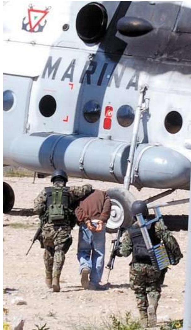
IMAGEN. Traslado del detenido en marzo de 2010

Miércoles 15 de junio de 2011 Redacción | El Universal